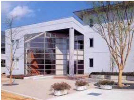
甲府国際交流会館（甲府市）