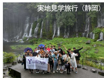
実地見学旅行(静岡)

日本語サポート SA による日本語学習サポートを受けたり、日本文化の体験、国際交流イベントへの参加等ができます。