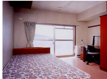
国際交流会館（甲府市）の部屋の様子