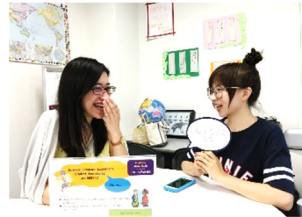
G-Philos (グローバル共創学習室) で 楽しく日本語会話

2. 「研修コース」の学生は、国際交流センター以外の教員が指導することもあります。