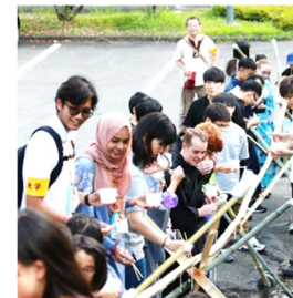
流しそうめん （「こおりゅうまつり」）