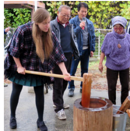
餅つき体験 （地域住民との文化交流会）